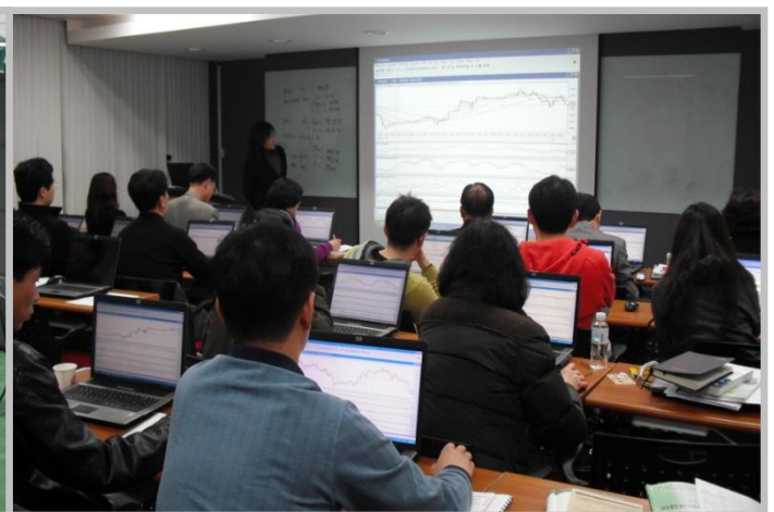
[ 제1기 외환트레이더 교육생 ]